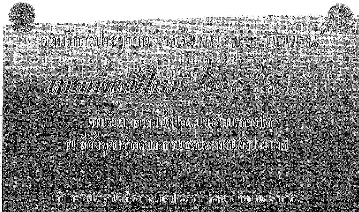
ป้ายขนาด 1.2 x 3 เมตร